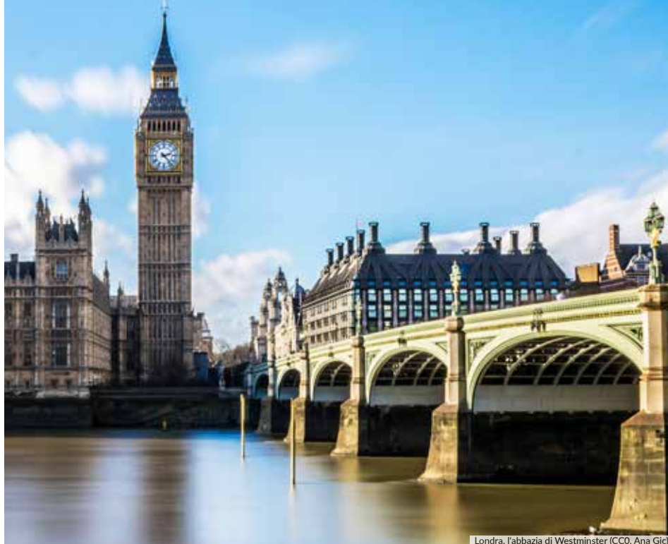
Londra, l'abbazia di Westminster