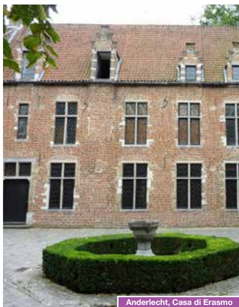
Anderlecht, Casa di Erasmo