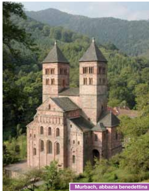
Murbach, abbazia benedettina

Sacro Romano Impero Germanico durante il medioevo, arrivando a controllare più di trecento località dei dintorni. Ci spostiamo nella vicina Guebwiller, piccolo centro ai piedi dei Vosgi, famoso per la coltivazione della vite. Qui visitiamo la chiesa di Saint-Léger del secolo XII. Trasferimento a Colmar, capoluogo del dipartimento dell'Alto-Reno, cittadina storica dalle case medievali e rinascimentali color pastello con travature in legno in evidenza. Sistemazione in albergo, cena e pernottamento.